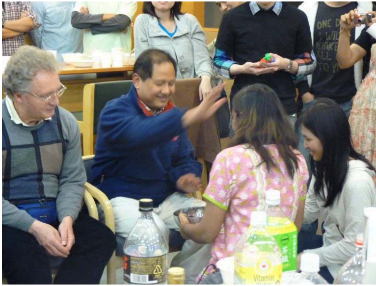
*潑水節的祝福儀式

其他跨文化的活動還包括泰國新年——潑水節！今年4月13號是泰國傳統新年，不過由於今年氣溫還是不夠高，所以大家決定在室內舉辦。儀式一開始是主辦代表向大家致謝，然後由數位美麗的代表捧著一盆清水，請上座的師長觸摸以示祝福之意。每位師長都會用手沾沾水，然後摸摸代表的頭，不過事後問一些師長，他們其實不太明白為什麼要這麼做，實在是人們在面對不同文化時很有趣的現象。欣賞完泰國同學的傳統歌舞、品嚐了泰國傳統料理後，不經意之間就會被冰冷的水澆灌，「Sawadee pee mai!」恭祝新年快樂的聲音此起彼落！不過收到祝福之後怎可不加以「回報」，手上的茶杯成為最好的容器，在場的每個人誰也躲不掉！除了冷水之外，不知哪位天才還裝了熱呼呼的水，被燙到的同學也只能唉唉叫了。