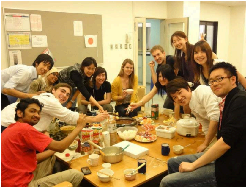
*Pasta & chocolate fondue party!

一週內約有兩到三天的晚餐是大家比較有空的時候，通常是兩兩一組輪流煮飯請大家吃。餐點從泰國涼拌開味菜、泰國最有名的 MAMA 泡麵、泰式春捲；台灣水餃、瓜子肉飯、麵疙瘩、沙茶花枝；日本親子丼、牛肉燉飯、相撲鍋、日式中華涼麵；美國漢堡包、披薩，墨西哥 tortilla，法式馬鈴薯、挪威版雞肉料理、各式義大利麵等等不勝枚舉，當然還有各式各樣的日式甜點、泰國榴槤糖、法國巧克力鍋和起司鍋、台灣大溪豆乾、挪威版起司蛋糕配草莓果醬(!)等等。大家一邊談天說地，一邊互相稱讚(偶爾或取笑)彼此的料理，飯後再輪流收拾善後。通常在宿舍廚房內常會看到不同國家的人聚在一起煮飯用餐，不過像這樣規律的 cross culture 聚會全校應該也只有我們這群人而已吧，即使不會煮飯也不要緊，互相幫忙、吃得開心最重要，也成為大家最美好的回憶！