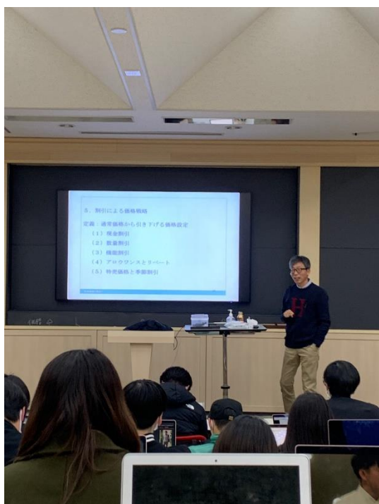
〈流通機関と機能〉の旁聽

日本語演講比賽大概於九月下旬開放報名，演講主題自訂，時長為3分鐘，只要母語非日語的學生就可以參加，因此，除了交換生外，雙聯學位以及本科的外國學生也都能報名，已經有過參賽經驗的人再度參加也是可以的，每個參賽者會被安排一位指導老師，協助講稿的修改與演講的表述，在正式比賽的約莫一週之前會有一次彩排練習。會由評審評選出3名得獎者，再加上一位觀眾投票的獲獎者，其他的參賽則會獲得名為特別審查獎（類似參加獎），雖然沒拿到名次，仍認為是個試著挑戰後不會後悔的有趣體驗。順帶一提，我參加的第四屆，總計7位的參賽者中有4名台灣人！