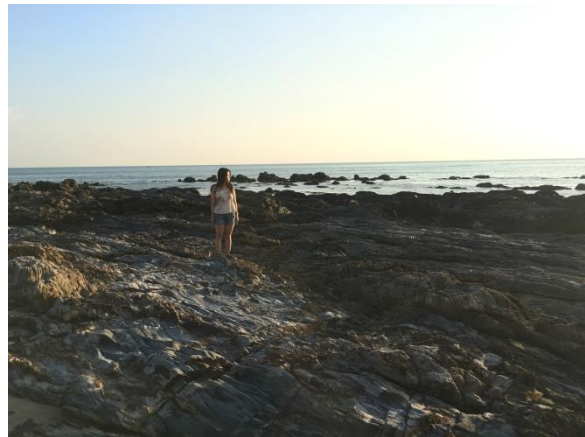
Ko lanta 的無人礁岸