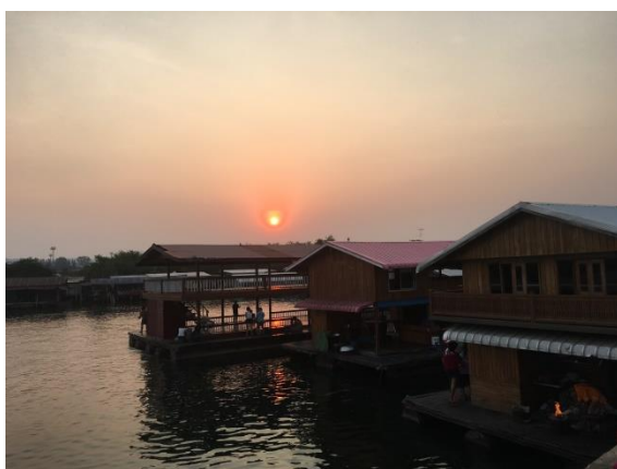
桂河大橋附近水上餐廳