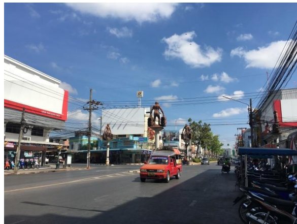
Krabi 鎮上的紅綠燈是各種動物