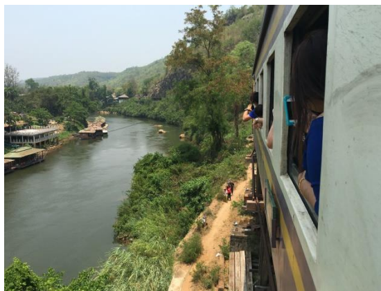
觀光套票坐火車，說泰文、用學生證據理力爭當地人的票價！沒冷氣，爆熱