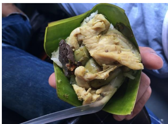
火車上會有人販售食物