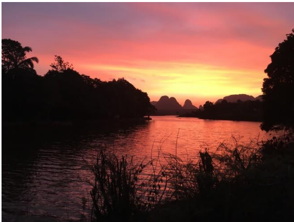
日出@ Nong thale