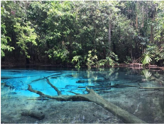
Emerald pool 附近