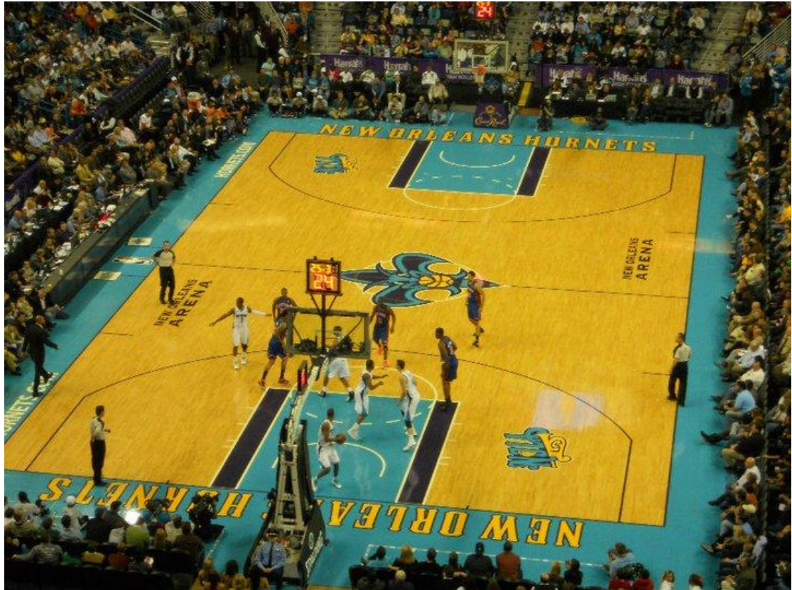
NBA New Orleans Hornets VS. New York Knicks