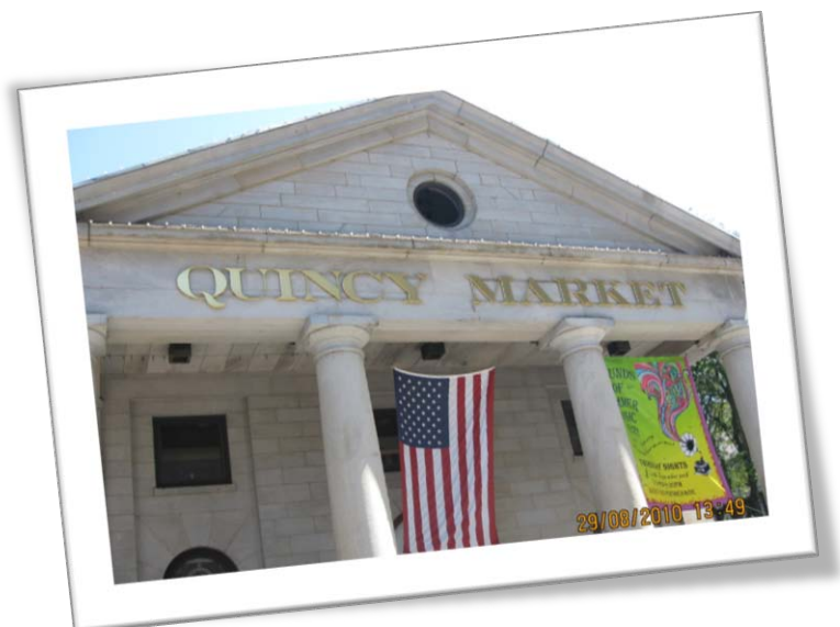
《Boston Landmark – Quincy Market 昆西市場》