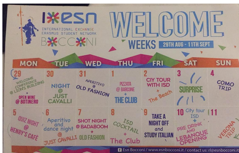
兩周 ESN 活動的 schedule

一開學就有超多活動，完全就是 party every day，開學後幾周星期一到五都有不同的 party，通常都辦在不同家夜店。最主要在辦活動的是 ESN ( Erasmus Student Network ) 社團，這個學生社團是歐洲最大的學生社團，主要舉辦各式各樣的活動給國際學生參加。除了 party 之外，ESN 也會在假日時舉辦一日遊或是兩天一夜的活動，像是有 Como 湖一日遊、Oktoberfest 兩天一夜活動等等，可以多參加活動認識其他交換生，也能夠認識一些義大利當地的學生 ( 建議真的要認識幾個義大利人，到時候有遇到一些義大利相關的問題想問的話很方便 XD )。