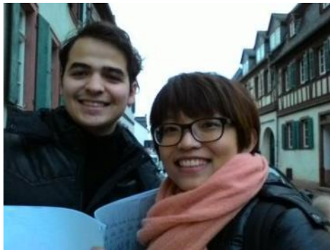
因為上語言課，提早到德國認識的法國同學

我參加的是 2015 年春季班的交換，1/13 就開學了，開學時間比其他歐洲學校都要早的許多。不過在開學前，還有一週選修性質的德語課，之前在報到的時候，學校就會讓你選擇要不要參加這一週的德語課，每個人可以依自己的德文程度去選擇班級。大部分的交換生都會選擇參加，這一週也是認識大家的好機會。另外，這一週的德語課老師們會要求你準備書，可以先在台灣問看看有沒有人有，用借的、或買二手書即可。不過一定要買，因為老師上課會一直用課本，如果沒買會跟不上。一週課程上完後會有考試，考試方式依各程度不同而不同，A1 考簡單的聽力跟閱讀，B1 則需要準備一小篇文章上台簡報。大概在課程快結束的時候，老師就會發單子詢問大家開學後繼續選修德語的意願，若對德語有興趣的人可繼續再選修，但是上課的方式就變成每週固定時間，不會像這一週這麼操。