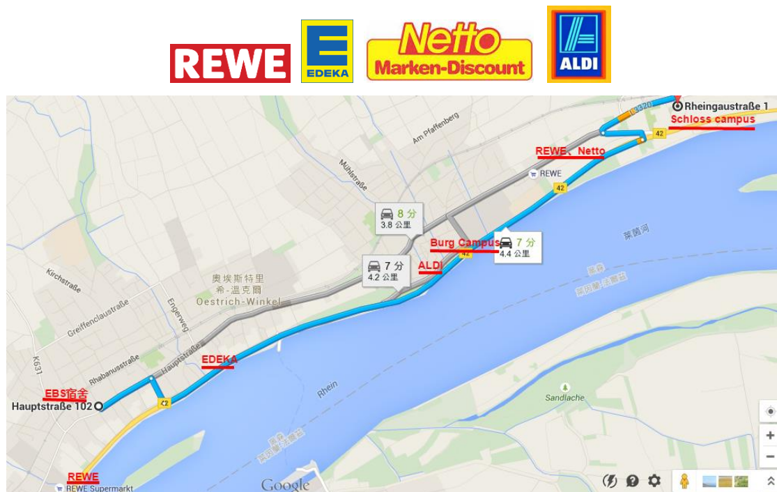
各家超市 LOGO 與位置示意圖

在德國交換，有相當大比例的生活需要依賴超市，而 Oestrich-Winkel 這個小鎮中就有德國四大超市 REWE、EDEKA、Netto、ALDI。尤其交換生活過程中，免不了一定要下廚，這可是交換生活最棒的回憶之一！也因為每天都想著要煮什麼煮什麼，所以幾乎兩三天就跑一趟超市。就算不買食材，逛超市也是一個很讓人享受的活動，待在裡面時間不知不覺就流逝一大半了！我最喜歡的超市是 REWE，REWE 的東西比較多、品質也比較好。雖然好像大家都覺得 REWE 不便宜，但是買久了自然會有心得哪家超市什麼東西最便宜，反正超市與超市之間也沒太遠，所以通常我都會一次跑好幾家。另外，德國超市就像台灣 7-11 一樣無所不能，連 sim 卡都買的到，買完後也可直接在超市儲值，許多人都推薦 ALDI 的 sim 卡，資費是最便宜的。