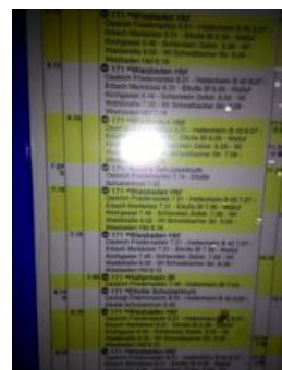
火車站、公車站(看到綠色黃底的 H 就是公車站)剪影