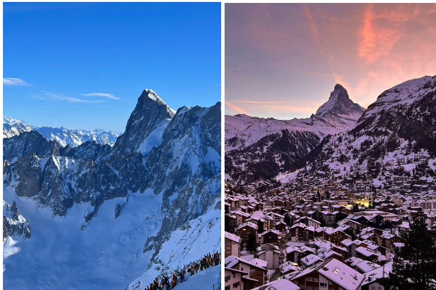
白朗峰(左)、馬特洪峰(右)

瑞士物價真的很高，因為跟我爸媽去就沒有一筆一筆記帳，但是餐廳裡一瓶可樂就要200多台幣，中餐廳一盤炒飯就要800多台幣。每個山都要坐纜車上去，很漂亮但票價真的很貴(有預算再去)