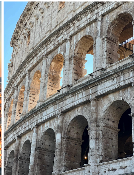
羅馬推薦Vittoriano看日落，學生票只要四歐，還看得到羅馬競技場跟古羅馬廣場