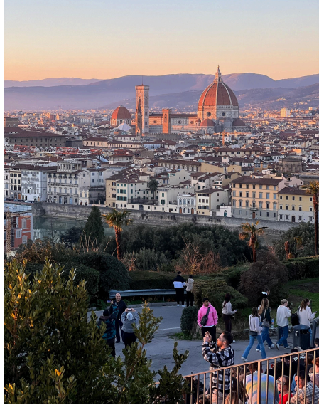
佛羅倫薩推薦米開朗基佛羅倫薩推薦米開朗基廣場看日落