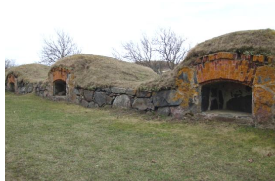
( Suomenlinna 景 1、2 )