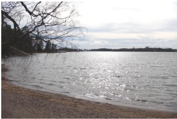
( Seurasaari 景 1、2 )

除了前一篇介紹的芬蘭其他城市可以去玩，還有一般網路上可以查到的市區內的小景點以外，Helsinki 臨近其實還有一些小地方可以去，如：整座島就是歷史遺跡的 Suomenlinna 芬蘭堡、Seurassari(中文好像翻伴侶島)有一些可愛老房子 ( 但我們冬天去沒東西...博物館也沒有逛到 ) 等等，這兩個都建議非冬天的好天氣去。芬蘭的景點比較少，也大多偏感受型的，有興趣的可以自己考慮去看看喔～！