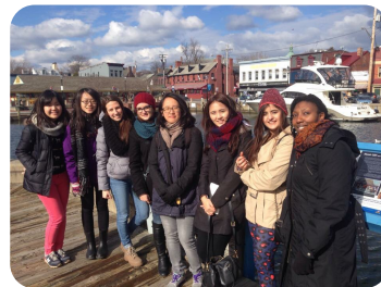
▲ 參與 OIPS 舉辦的 Annapolis Trip