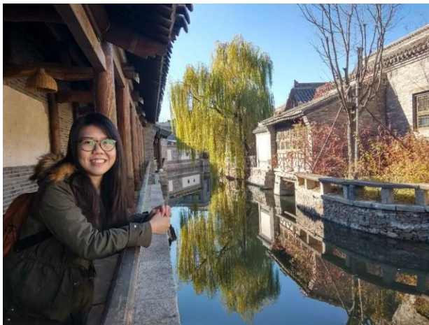
古北水鎮+司馬台長城一日遊