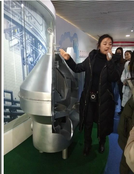
三元食品企業參訪