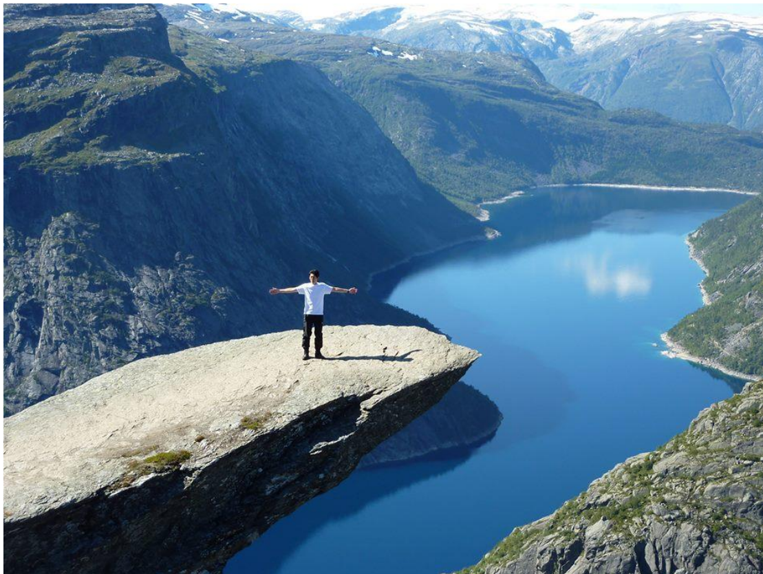
—攝於挪威 Trolltunga(惡魔的舌頭)

曾經，我的世界很狹隘，畢業工作賺錢買房子，短短的兩個月間，遇到的人事物告訴了我，生活的選擇不只有一種。也許有人說，大學是自我認識的過程，但離開自己的舒適圈，展開一趟壯遊，當面對不同語言、顏色的人時，我似乎才第一次從世界的角度真正認識了我自己。