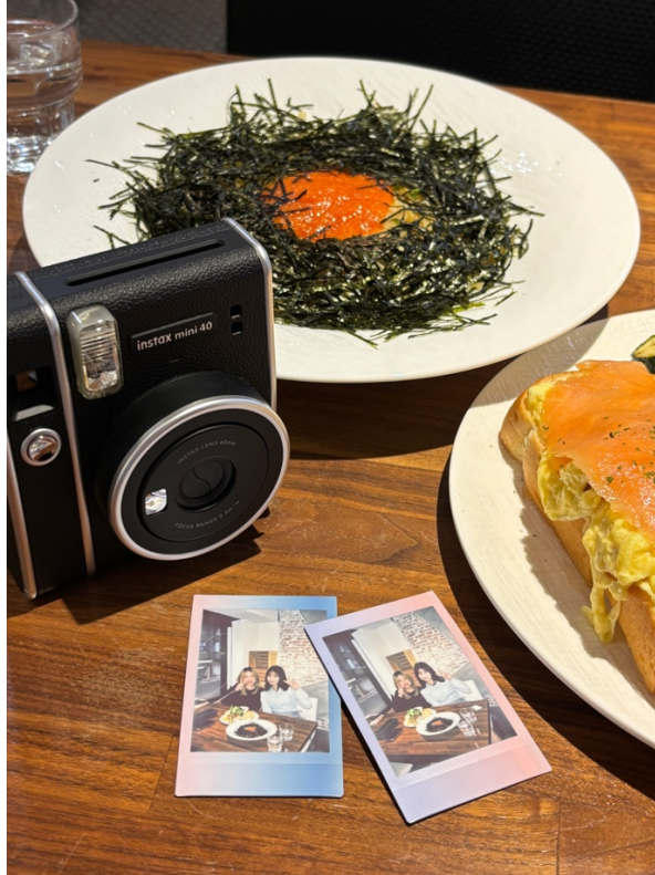
▲ 2025/05/10 帶我的學友 Fugee 去北車附近吃早午餐以及逛國立臺灣博物館