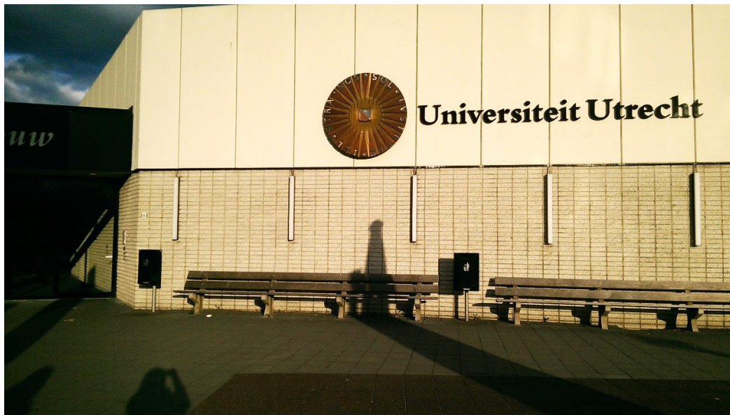
【圖 1】烏特列支大學某校區

恰逢 UU 的 Green Office 社慶之日，有幸和他們一同歡慶並對他們整個社團經營有完整的認識，更獲得了一些社員寶貴的想法。