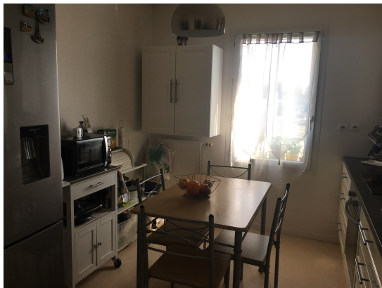
上圖：伊斯蘭教的法國朋友家，非常整齊且一塵不染（右上角的房間是被我弄亂後照的）