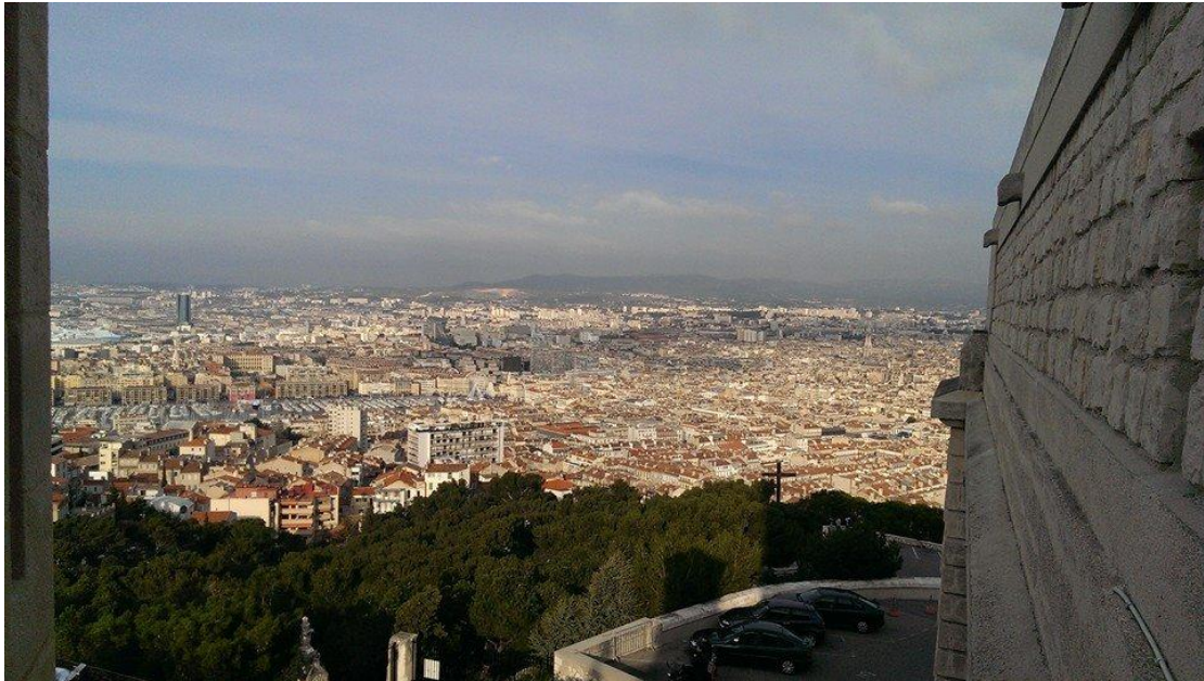
從教堂可觀看馬賽全景