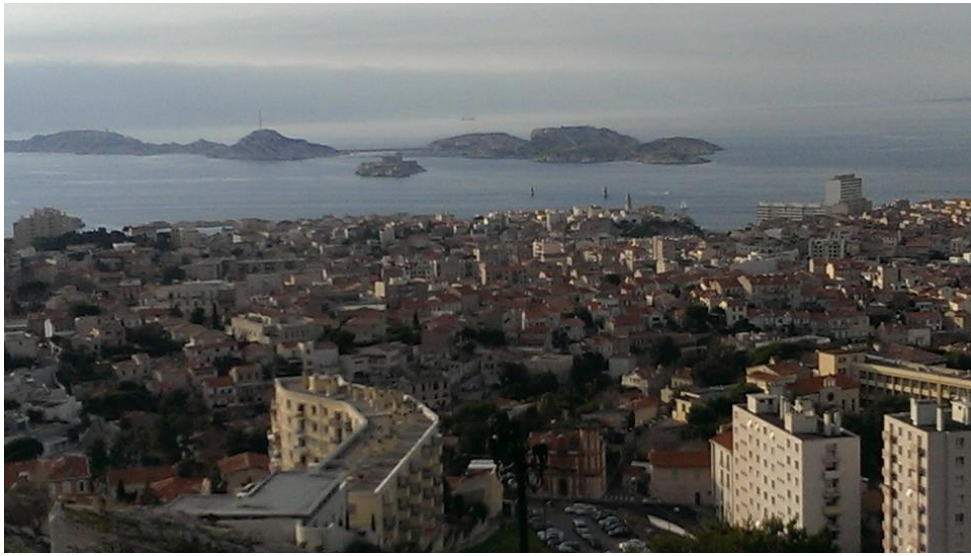
從教堂遠眺依芙島