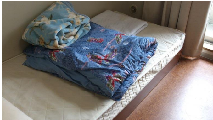
↑ 床 (有附新的床單、被套、枕頭套)