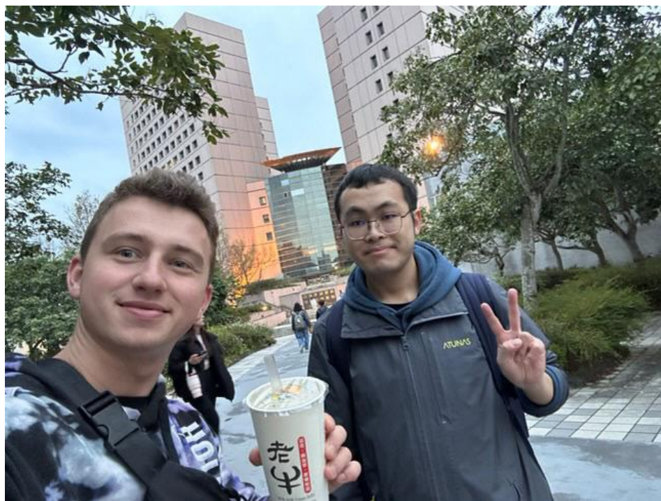
照片*2 (含文字介紹、拍攝日期及地點活動名稱)