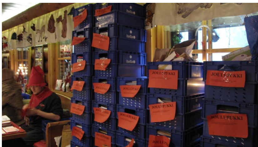
來自世界各地給聖誕老人的信件

我們一行人從赫爾辛基一路坐北極特快車前往 Rovaniemi，到達車站時，天還未亮，我們就先去參觀聖誕老人村，聖誕老公公每天收到來自世界各地數以萬計的信件，我們也在哪裡郵寄了數十張的明信片給親朋好友，裡頭工作的小精靈可是忙得不可開支呢。我也在那裡乘坐了雪白的麋鹿，麋鹿輕快地走在白雪皚皚森林裡，十分夢幻。