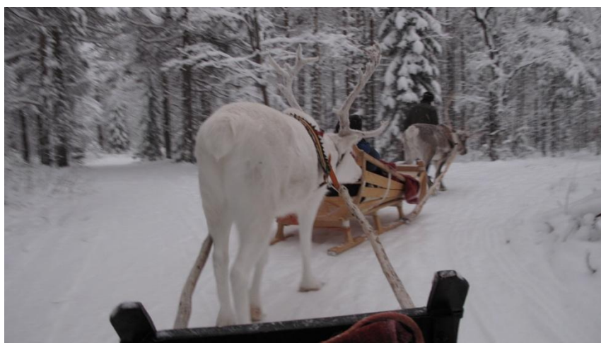
雪白的麋鹿在銀白的森林裡