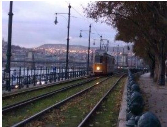
(多瑙河河岸美麗 2 號電車)