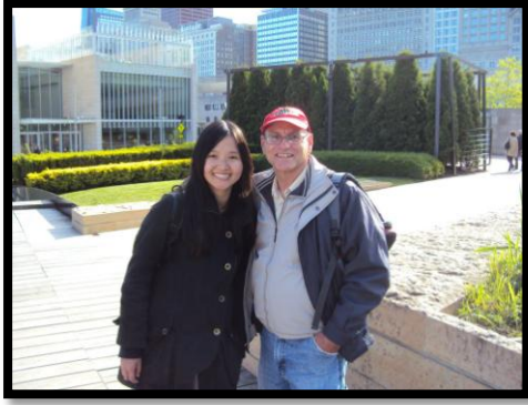
圖:在芝加哥時，有時候會有人主動想找我講話，或是問我是否需要幫忙。拿一份地圖在手裡，加上開口問路人，一個人在陌生的城市找路並不難。