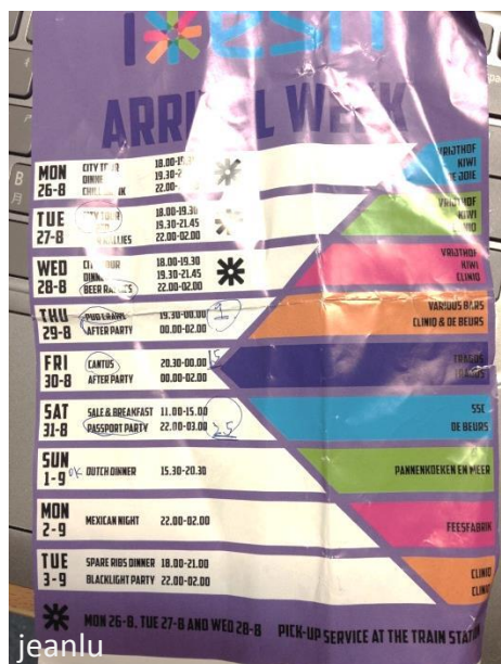
開學週 ESN 的活動日程表單

OV 卡也可以搭火車(儲值金額至少 20 歐)，不過若沒有火車折扣卡的話，就是原價搭火車，並不太划算，以阿姆斯特丹到馬斯垂克單程就要 20 多歐的火車錢，到其他地方單程也大概要十多歐。建議有機會的話，可以買火車天票(NS Dagkaart)，天票可以在同一天無限次搭車 NS 火車，可以不時注意 HEMA、Blokker 或是 Kruidvat 的店家資訊。