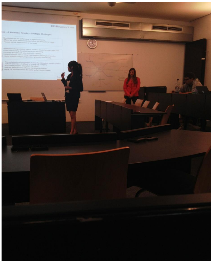
圖一:Presentation 中的我和 Partner

這個 module 裡頭分成兩個 course : Advanced strategy 和 consulting workshop 。 Advanced strategy 老師將班上的同學分 3-4 人為一組，每一組被分配到不同的 reading 。每一次的課堂時間老師會花一小時左右講解這份 reading 的理論，再由同學報告細節。這堂課沒有考試，每一組的報告和出席率就是評分標準。雖然如此，在每一次上課之前還是必須把每週的 reading 先念過一次才能回答老師在課堂中隨機提出的問題。