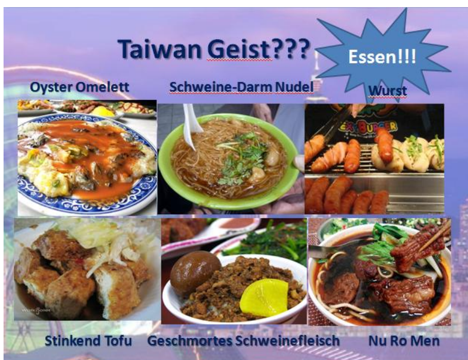
圖六:用德語介紹台灣美食

EBS 會在開學前提供免費為期一周的密集德語課程。這是選擇性參加的課，不過可以有學分數，又對於增強德語能力非常有幫助，所以強烈建議參加。老師上課是不講英文的，一開始雖然聽得有點吃力，不過最後漸入佳境，也覺得德語進步很多。德語課的最後老師要我們上台用德語介紹德國的城市，這是我第一次用德文 presentation，發音不是很標準，老師還是很給面子的給了不錯的分數。上玩了密集的德語課程之後，在學期中我又自己選了中級德文上課，目的是為了給自己能夠一直接觸德文的機會(畢竟在德國幾乎每個人都會講英文，能用到德語的機會並不多)中級德文期末的報告是用德語介紹自己的城市。也讓我有機會能好好搜尋台灣的美景美食。最後大家看了我介紹台灣的美食都非常想來台灣旅遊！