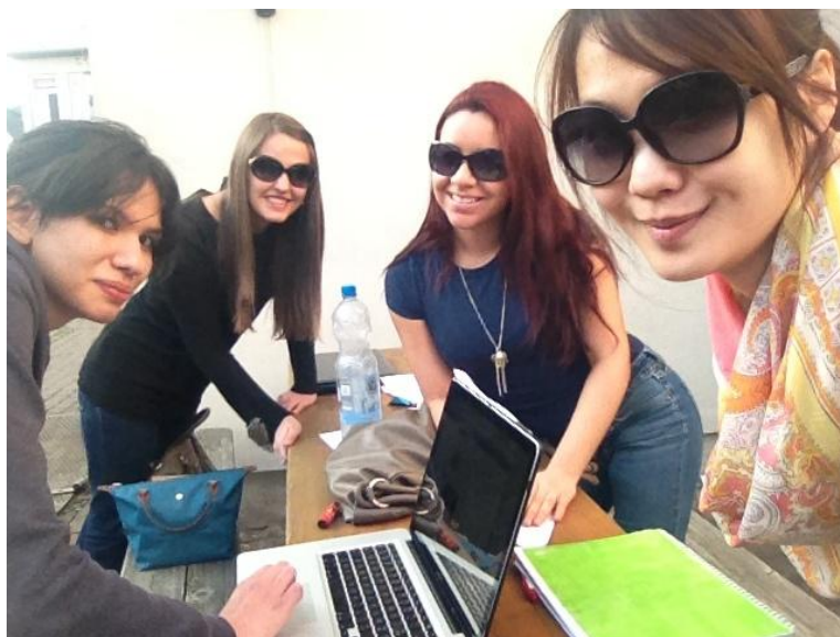
圖五:在太陽下排練