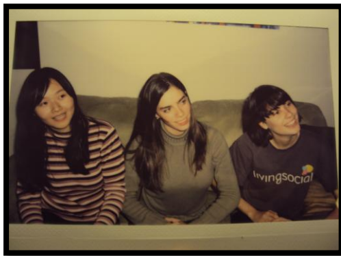
圖: 我跟我兩個室友們，他們對我非常好，經由一些對話和互動讓我深入了解美國文化或特別的事情。

我的公寓在 Downtown 的區域，接近 Main street ，相對來說熱鬧很多的地方，很多餐廳、夜店、酒吧都在這裡，出入的人雖然比較複雜，因為假日的開趴後有很多醉漢，公園那一帶也有一些遊民，但基本上我只要走在大馬路人比較多的地方就不怕危險了，另外晚上也要避免單獨外出。在到一個新環境前最好多問問當地朋友了解狀況。