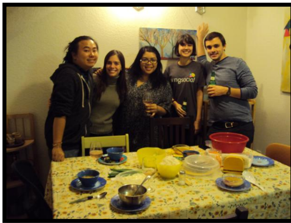
圖: 透過了我的室友我也認識了他們的朋友，這五個人是我幾個月來最親近的人，因為室友會邀請熟人到家裡來開派對或單純吃晚餐!

圖: 我跟我兩個室友們，他們對我非常好，經由一些對話和互動讓我深入了解美國文化或特別的事情。