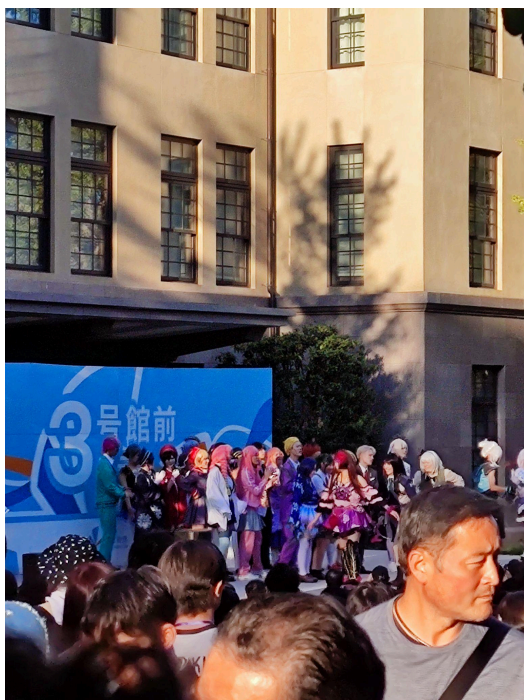
↓主舞台正在大團舞的學生coser們