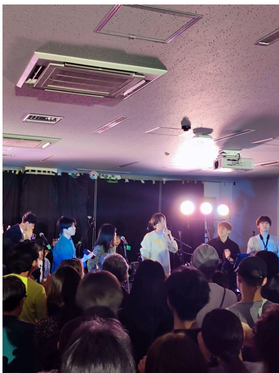
↓熱音部在教室裡的演出，觀眾超多超嗨的！