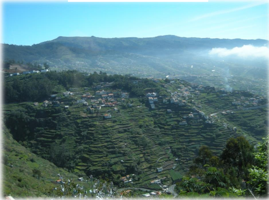
Car tour 可至山頂鳥瞰全島、瀑布、自然生態