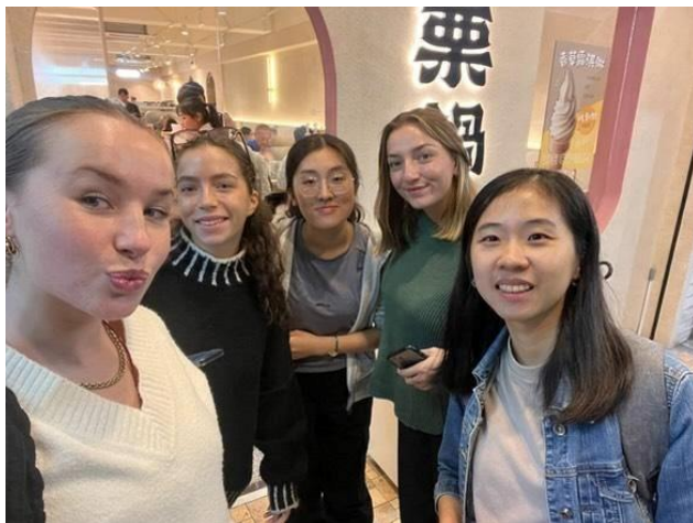
我們五個人一起在餐廳外面合照