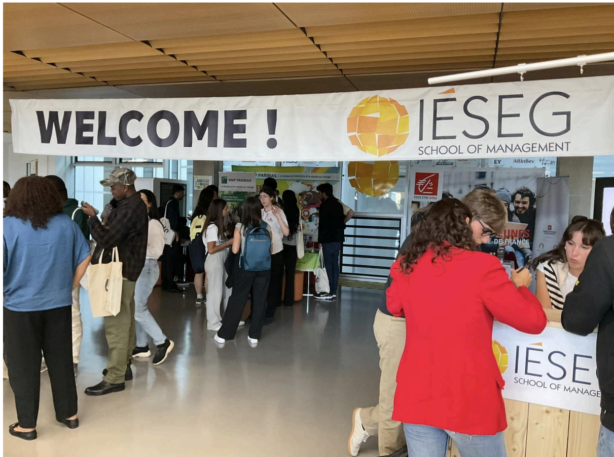
↑會後國際學生們在大廳銀行攤位諮詢開戶服務

1000歐元起跳，可以感受到巴黎居實在大不易。另外在Lobby也有2-3間銀行會駐點大約兩週，提供給學生多樣化的開戶選擇。雖然我早已經在學校附近的銀行開戶，但還是覺得這項服務相當貼心又方便，而且在攤位上也會提供開戶以外外加房屋保險等優惠方案，畢竟法國銀行開戶流程以繁瑣聞名，能夠在學校一次搞定，對初來乍到的外國學生來說也是個福音。