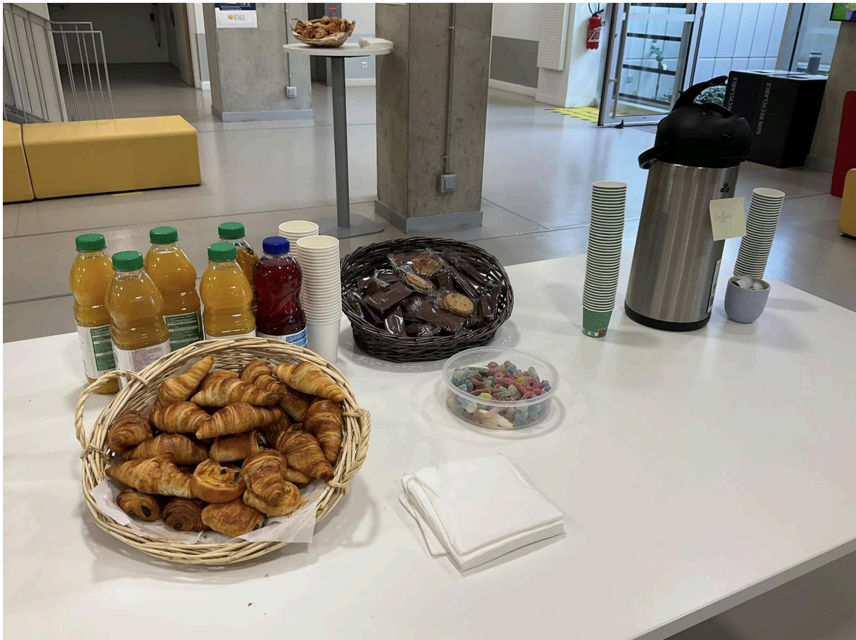
↑不期不待不受傷害的早餐

迎新日不論是在台灣還是法國都可以想像是一場資訊轟炸的馬拉松，另外對外國學生的意義還有可以獲得免費食物的機會。迎新的第一站是學校準備的簡易早餐，不過對於法國的早餐不用抱太大期待，踏入活動場地PJ Hall映入眼簾的是熱茶、熱咖啡、果汁，以及一排麵包。早餐時間就是社交時間，可以看見學生們依照語言很快速地組成小團體聊天，看起來西班牙與義大利族群相當多，而亞洲人就相對少數，我只有看到來自中國、韓國的其他學生。早餐後校方開始發放歡迎包與學生證，IESEG的學生證相當自由，學校只是發給我們一張印好個人資料的學生證與封膜，照片可以自行貼上，貼上照片後就正式地成為了IESEG的一員。