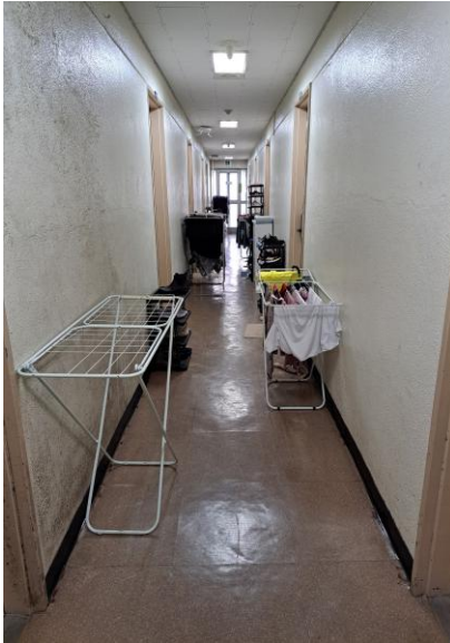
← Pajungsa 走道