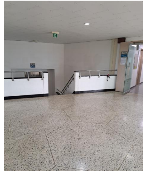
Pajungsa 頂樓 →