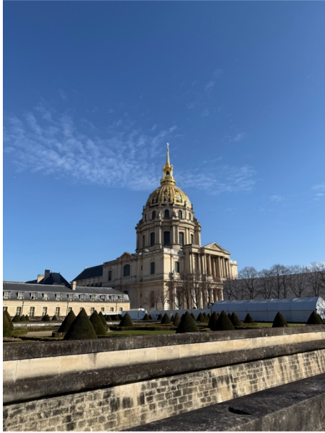
8. 巴黎證交所（私人博物館要學生票）