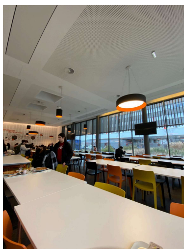
Resto U' Paul Appell