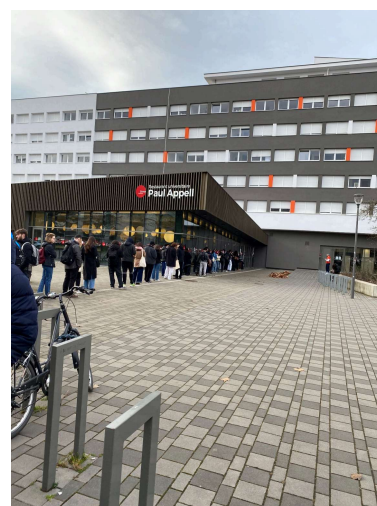
Resto U' Paul Appell用餐時段的樣子