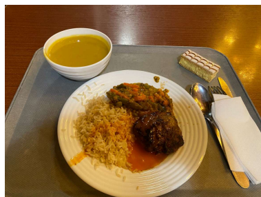
Resto U'Gallia : 甜點竟然沒有盤子，蠻神奇的