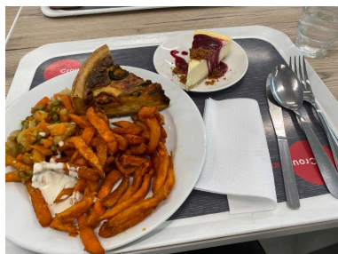
Caf t ria universitaire du PEGE : 每次甜點看起來都好好吃