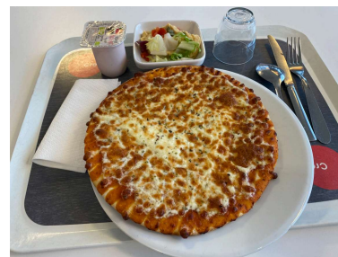
Resto U' Paul Appell : 日常吃飯最方便的選擇