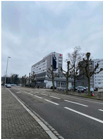
圖一：宿舍外牆的貓咪很可愛