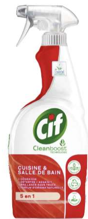
圖三：這款清潔劑非常好用，浴室刷的很乾淨