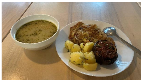
（波蘭牛奶吧常見傳統菜餚）

再來是自煮，也是我為了開源旅遊預算而最常使用的部分，小瓢蟲超市（Biedronka）是當地最普遍的連鎖平價超市，而 Lidl、Auchan 等折扣超市也幾乎遍布市區。由於自身沒什麼廚藝天分，所以蔬菜和肉類基本上都以弄熟並以鹽巴簡單調味為主。若結識外國同學則有機會解鎖其他異國菜色，像我的義大利朋友教會我煮 Carbonara 義大利麵。至於超市食材，我認為歐洲高麗菜很難炒出台灣嫩脆的水準，故可斟酌使用。而我最推薦的食材則是 Biedronka 的鮭魚(łosoś)，通常一大片約 150—200 台幣便可配即時白飯快煮包飽餐一頓。若想拌炒肉類，則可多家善用超市販售的各式炒醬與調味辛香料，相信大家善用 AI 都能煮出自己心目中理想的味道！