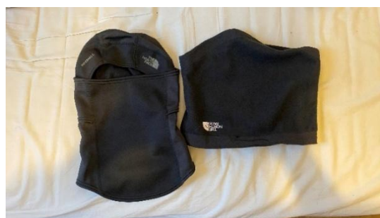
（The North Face 極圈用脖圍與防風套）