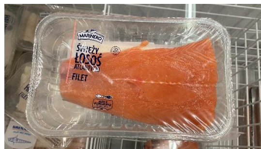
（小瓢蟲超市的鮭魚）