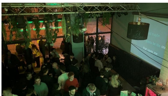
(左圖：與商院 OIP 老師合影留念)