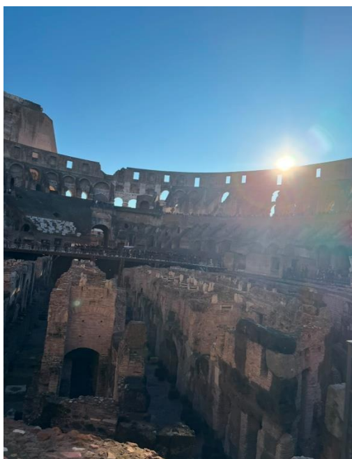
(圖三)競技場地下層