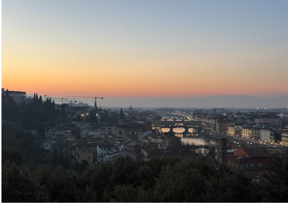
(圖五)米開朗基羅廣場日落

大部分義大利人都會說最喜歡的城市是佛羅倫斯，畢竟這裡是文藝復興的搖籃，烏菲茲美術館及學院美術館都可以逛上很久。另外很建議要去鐘塔或是米開朗基羅廣場看日落，真的很漂亮。