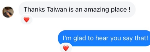
分享台灣的特色零食和餅乾 2024. 6. 17. 政大商院