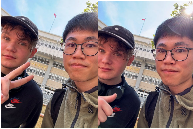
2024 2/18 帶他逛完校園後，在圖書館前合照留念