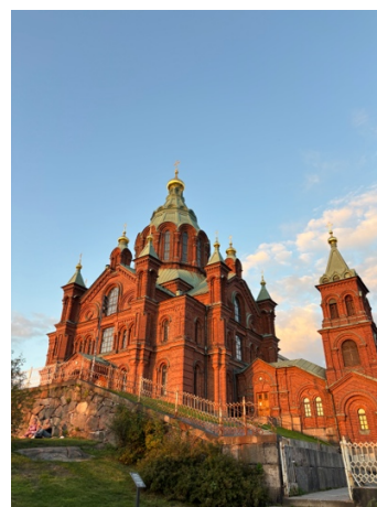
烏斯佩斯基大教堂