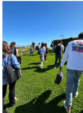
會在頂樓草地上上課