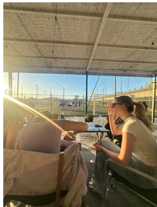
足球交流賽可以自由參加