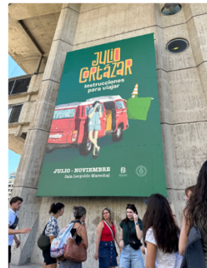
語言課每週校外教學參觀