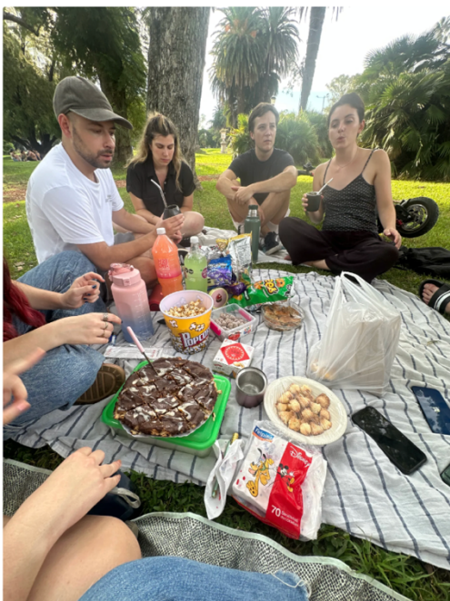
buddy聚辦假日野餐交流