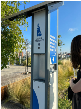
學校頂樓還有熱水提供站