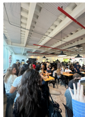
學校餐廳大排長龍