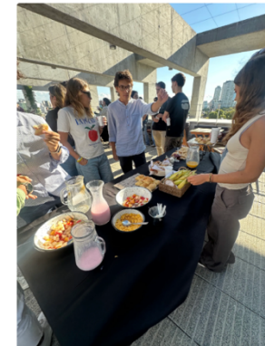
國際事務處會不定期舉辦聚會