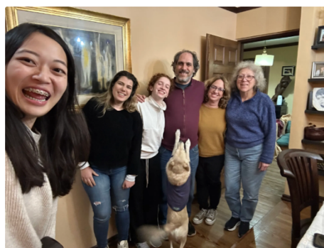
(右2) home媽邀請學校同學一起開趴吃home媽自製 empanada