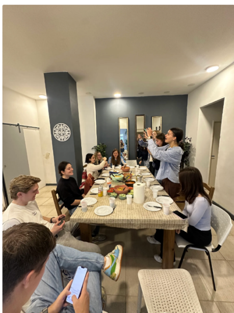
(上) 跟住附近的交換生聚會

Palermo 這區離學校搭公車約 30 分鐘-1 小時，也有地鐵，而通常大家晚上聚集的地方是 Palermo Hollywood（酒吧夜生活較多）和 Palermo Soho（咖啡廳商店百貨較多），home 媽家靠近後者但也離 Hollywood 走路約 15-20 分鐘，而在我去的 2025 年上半年時開始有整頓首都治安，在 Palermo 這一區晚上自己走路是安全的，有時候也會跟交換同學一群女生半夜一起走路回家都算是安全的，但出這區可能就要小心一點。