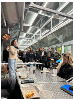
交換生和當地buddy交流