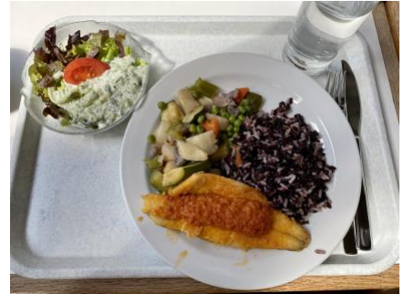
學餐價格約 CHF10~13，不只外地生，許多當地學生同樣抱怨