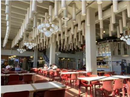
Unithèque 的餐廳與圖書館內部，因其建築形狀又稱 la « Banane »