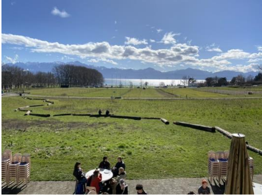
餐廳與圖書館向外望的風景

UNIL 的建築和教室都十分舒適、整潔，設備也都十分完善，令初至校園的我感到很驚艷，我的第一感覺是：能在這樣的一個環境就學，這邊學生好幸福啊！