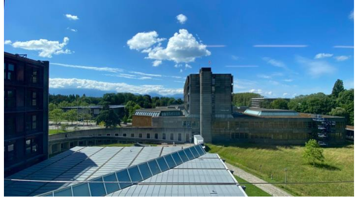
從教室向外望的風景