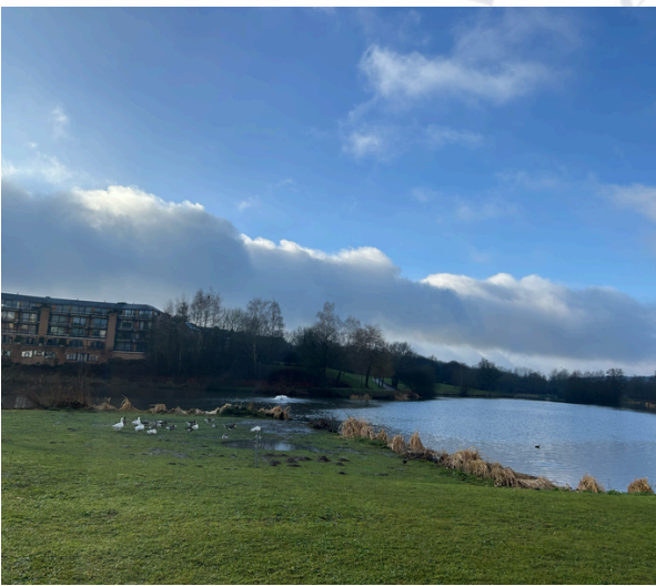
green lung of Louvain-la-Neuve