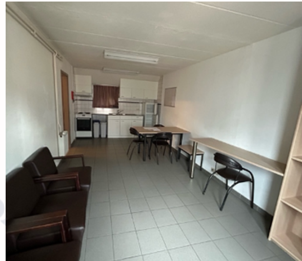
很大的廚房和交誼廳