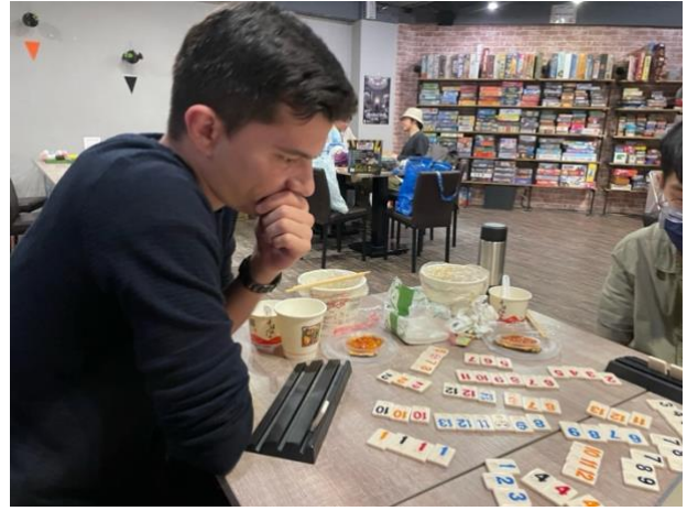
我與朋友邀請學伴一起去桌遊店玩 / 2023.10.27 / 玩桌遊