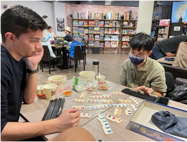
照片*2 (含文字介紹、拍攝日期及地點活動名稱)