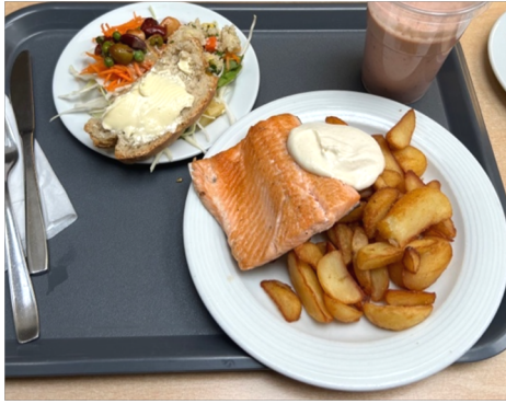
( Aalto 的鮭鮭鮭鮭鮭魚～ )