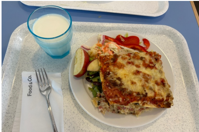
( Hanken Pizza Day 的 Pizza )