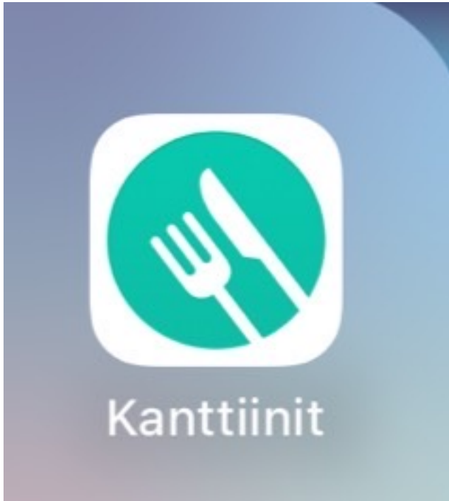
( App 的圖示 )