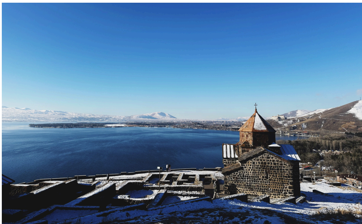
塞凡湖 Sevan Lake，遠方雪山環抱著湖，修道院矗立其中，是整趟亞美尼亞旅行最喜歡的地方

說了這麼多，總之就是我們只有照原定的行程玩亞美尼亞，雖然波折不斷，但亞美尼亞的自然風景真的很值得造訪，有湖景、雪山、各種修道院（亞美尼亞是世界上第一個將基督教定為國教的國家，所以境內超多古老修道院），加上觀光客不多、天氣很棒（跟溫帶大陸型氣候很不一樣，不會動不動就陰天下雨，每天都是大太陽，但一樣蠻冷的就是了），整體十分輕鬆寫意，跟在歐洲玩完全不一樣的感覺。亞美尼亞人有點冷漠，但治安非常好，街道安靜乾淨，晚上走在路上也不擔心安危，消費超級便宜，市區內搭計程車單趟都60台幣以內。亞美尼亞也是歷史悠久的國家，曾經被羅馬帝國、拜占庭帝國、波斯帝國、塞爾柱土耳其人到近代的蘇聯統治過，中間不斷被侵略又獨立，擁有許多文化融合的建築，是整趟交換裡面讓我最印象深刻的國家，非常推薦來這裡走走！