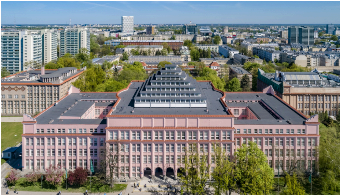
SGH 的 G Building，是最主要上課的地方，就在 Pole Mokotowskie 地鐵和電車站一出來的隔壁

其實當初SGH並不是我的第一志願，但我覺得很幸運可以來到華沙交換，不僅物價相較西歐便宜很多，學校宿舍離機場、火車站、巴士站都很近（言下之意就是很適合出去旅遊哈！），也不用擔心找不到房子，因為交換生幾乎都住得到宿舍（而且宿舍費很便宜！每三週提供免費換洗床單被單的服務），總之非常推薦來SGH交換！