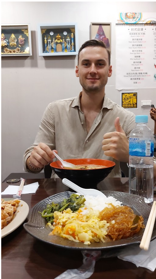
找他一起吃泰式料理(0913)