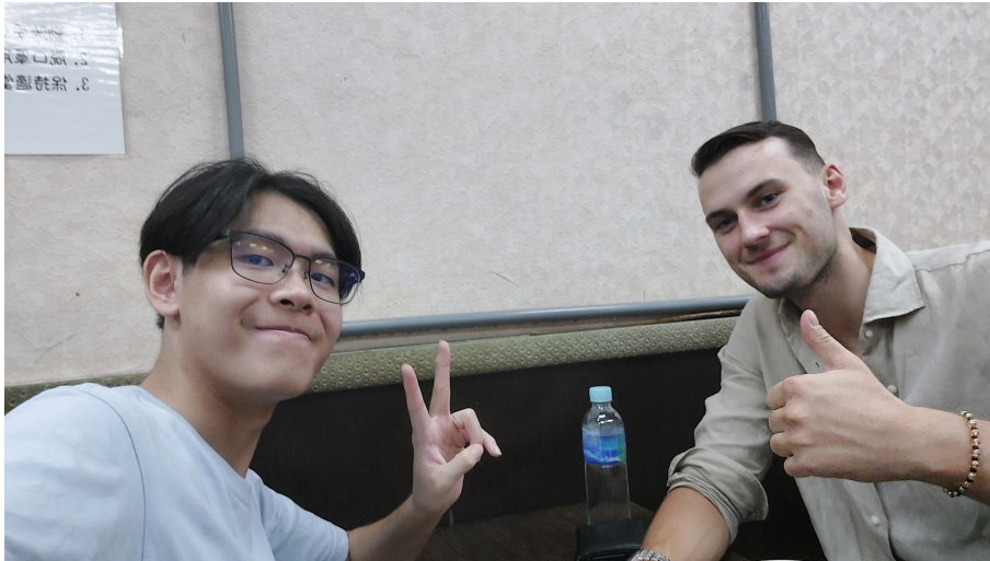
開學前帶他嘗試台灣的豆花，就在學校外的明池豆花店(09/07)