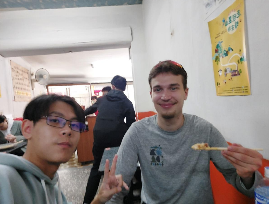
2/17 這是其中一次邀請他到同洋燒臘用餐，但他不太習慣