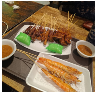
Satay @ Lau Pa Sat