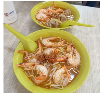
Blanco Court Prawn Mee @ Haji Lane