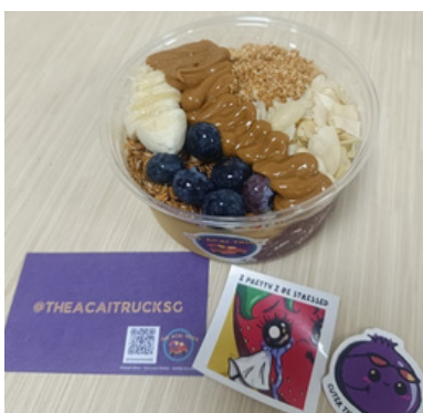
Acaitruck @ PGPR