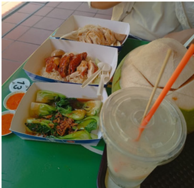
Hainanese Chicken Rice @ Maxwell Food Centre