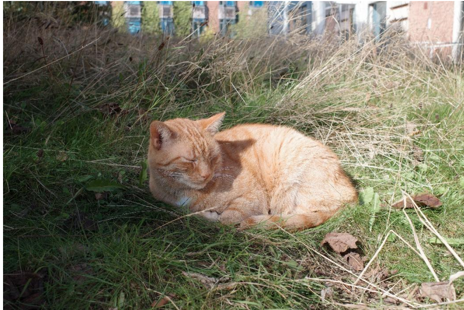
(學校常見的小橘貓 Napoleon IG: @napoleon_thecampuscat)

Fair，是辦給二年級學生，讓他們了解交換目的地的博覽會。我有去當志工，遇到一些對台灣有興趣的學生，能幫助他們更了解台灣我覺得還蠻不錯的，但學校偏晚才寄信通知有這個活動，所以我來不及跟政大要文宣。