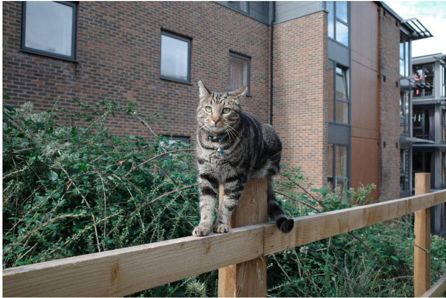
(偶爾在宿舍區看到的貓)

網卡我一開始是用 giffgaff，可以在台灣就先拿到 SIM 卡以及電話號碼，也不用綁合約，到英國之後發現 Voxi 的方案更好，就換成 Voxi，可以把電話號碼轉過去，一樣不用綁合約，一個月 £10，有 60G 流量，社群媒體無限流量。