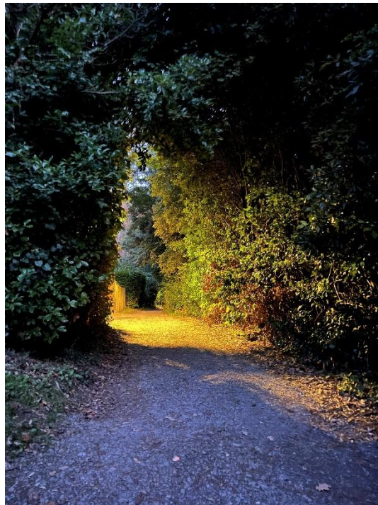
(宿舍到校區的其中一段路)

兩個選項只有房型的差別，好像是因為第一學期的租約只有 17 個禮拜，沒辦法選合約是一年的宿舍。Duyards 有點偏僻，走到學校校區要 20 分鐘，路程中還要一直爬坡，而且 google 地圖建議的路線要爬樓梯，我後來發現有走起來更輕鬆一點的路線，不過都是樹，晚上有點暗，所以如果住到這個宿舍可以再自己研究看看。距離市區走路大概 30 分鐘，宿舍附近有公車站，但是公車班次沒有像台北那麼密集，有的時候走路和公車的所需時間差不多。我剛到 Exeter 的時候去市區買一堆東西，打算搭公車回宿舍，結果公車要等 30 分鐘，Uber 也叫不到，順帶一提我後來發現這裡主要用 Apple Taxis 叫車。