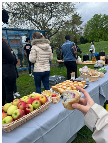
入住當天迎賓點心

平日大概10-15分鐘有一班，其實蠻方便的，但我宿舍走到電車站要十分鐘。假日就半小時一班，所以如果有跟別人約或是出去玩都需要注意時間。