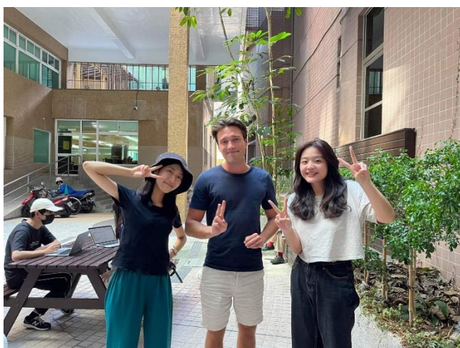
▲在商院中庭的快樂午餐，最右邊是可愛又超會聊天的學妹(2022. 09. 21)

為了讓他嘗嘗台灣味，決定帶他去買佳味的自助餐便當，再與學妹會合。午餐時光很快樂，學伴分享他第一次遇到地震，會說的中文只有你好跟八，在短短開學不到一個月的時間，已經去了宜蘭頭城跟故宮，可惜在故宮沒看到有名的東坡肉，之後想去小琉球玩。學妹跟她的朋友也很有趣，原來和外國人聊天交朋友也可以這麼輕鬆自在，希望我明年去法國交換時，也能憑這次的經驗和外國人交朋友！